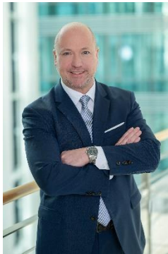
Univ.-Prof. Dr. Tobias Thomas

In Österreich leben rund 760 000 Menschen mit „registrierter Behinderung“. Sie beziehen Pflegegeld und/oder besitzen einen österreichischen Behindertenpass, haben den Status „begünstigt behindert“ oder weisen einen amtlich festgestellten Grad der Behinderung unter 50 % auf. Im Alltag sind Personen mit Behinderungen nach wie vor mit zahlreichen Hindernissen konfrontiert. Diese Hindernisse auszuräumen oder zumindest zu minimieren, damit alle Menschen gleichberechtigt, selbstbestimmt und uneingeschränkt am gesellschaftlichen Leben teilhaben können, ist das wesentliche Ziel der UN-Behindertenrechtskonvention, die in Österreich 2008 in Kraft getreten ist. Die Strategie zur Umsetzung dieses Ziels auf nationaler Ebene hat die Bundesregierung im Nationalen Aktionsplan Behinderung 2022–2030 festgeschrieben und hier auch nachdrücklich auf die Bedeutung statistischer Daten und Analysen hingewiesen, ohne die weder eine Messung des Fortschritts bei der Umsetzung noch die Evaluierung politischer Maßnahmen möglich ist. Statistik Austria arbeitet seit 2023 im Auftrag des Bundesministeriums für Soziales, Gesundheit, Pflege und Konsumentenschutz an einem zweijährigen Pilotprojekt zum Aufbau einer Dateninfrastruktur für regelmäßige Statistiken über Behinderung und Teilhabe.