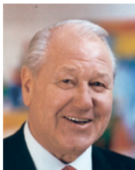
Karl Blecha © PVÖ