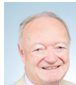
Dr. Andreas Khol

Der österreichische Bundesplan für Seniorinnen und Senioren ist ein einzigartiges Dokument in Europa. Kein anderes Land kann eine derartige Handlungsanweisung zur Herstellung, Wahrung und Hebung der Lebensqualität der älteren Menschen vorweisen.