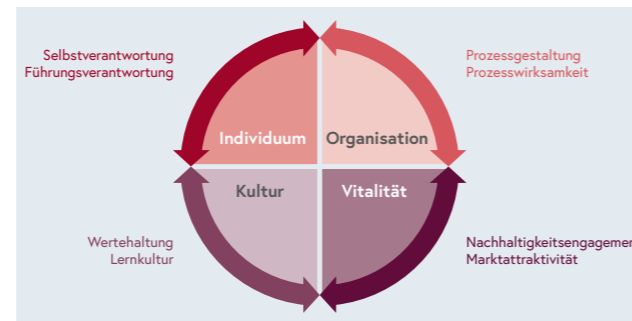
Abbildung 1: Vier Handlungsfelder NESTOR GOLD

Der ganzheitliche Ansatz des NESTOR GOLD GÜTESIEGELS wird in vier Handlungsfeldern abgebildet. Diese Handlungsfelder enthalten konkrete Indikatoren, deren Erfüllung im Rahmen des NESTOR GOLD Assessments überprüft werden.