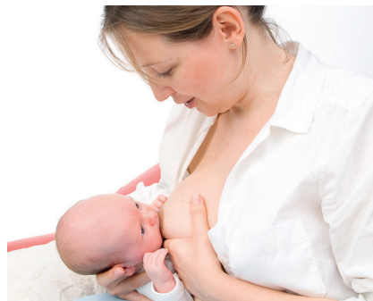
VSLÖ, © www.karlgrabherr.at

Setzen Sie sich auf einen Sessel oder besser auf ein Sofa, halten Sie Ihr Baby stabil im Nacken, sodass Daumen und Zeigefinger etwa bei den Ohren zu liegen kommen. Bei dieser Stillposition sind Kissen (Stillkissen) besonders hilfreich!