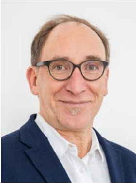
Bundesminister Johannes Rauch