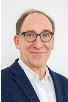
Johannes Rauch

Der Klimawandel hat nicht nur unmittelbare Auswirkungen auf unser Leben, unsere Umwelt und unsere Wirtschaft, sondern auch auf unsere Gesundheit und unser Gesundheitssystem. Hitzewellen, Dürren, Starkregen, Überschwemmungen und Hangrutschungen sind auch in Österreich von Randerscheinungen zu ständigen Bedrohungen geworden. Gegen diese Folgen müssen wir gemeinsam auf allen Ebenen vorausschauend entgegenwirken – nicht zuletzt, um die Versorgungssicherheit in Österreich auch in Zukunft zu gewährleisten.