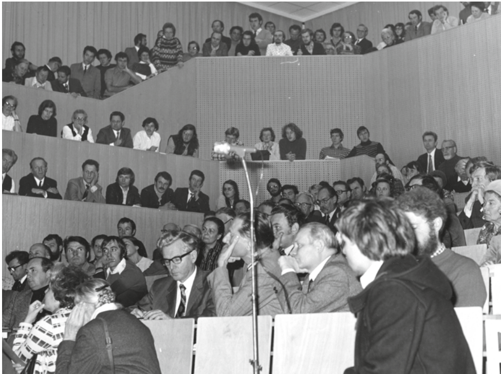
Hörsaal BOKU, 1976