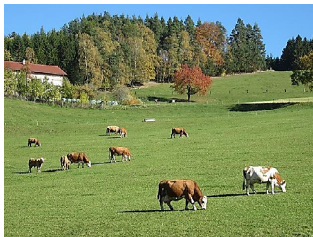
Rinder auf der Weide.

Das zweite Problem war die strenge Auslaufverpflichtung, was besonders für Bergbäuerinnen und Bergbauern in steiler Lage sensibel war, denn auf Steilhängen ist oft die Fläche dafür nicht vorhanden bzw. auf eisiger Steilfläche ist die Verletzungsgefahr hoch. Dann könnten viele Bergbäuerinnen und Bergbauern keine biologische Produktionsmethode wählen bzw. müssten wieder aussteigen, obwohl sie von der Umwelt her die beste Voraussetzung dafür hätten. Mittlerweile wurde diese Situation entschärft, denn für Tiere, die sich den ganzen Sommer über auf der Weide aufhalten, sind die Auslaufverpflichtungen für die Winterzeit weniger streng.