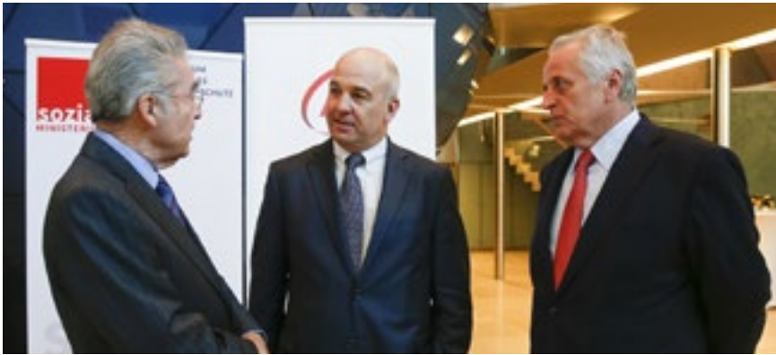
Eröffnung (v.l.n.r.): Bundespräsident Heinz Fischer; Menschenrechtskommissar des Europarates Nils Muižnieks und österreichischer Bundesminister für Arbeit, Soziales und Konsumentenschutz Rudolf Hundstorfer.